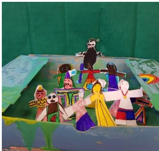
CE1 de l'école primaire « Calvinhac » à Toulouse (31000)