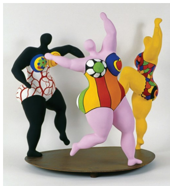
Les Trois Grâces, Niki de Saint Phalle

Toute l'équipe OCCE est ravie de vous retrouver